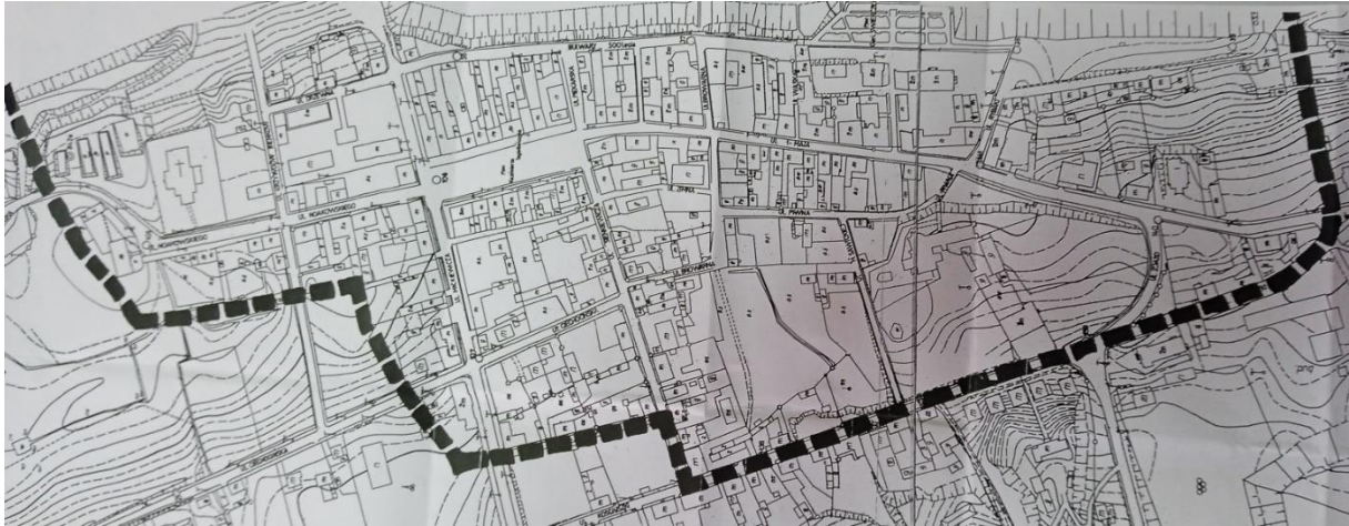
Układ urbanistyczny miasta Nieszawa