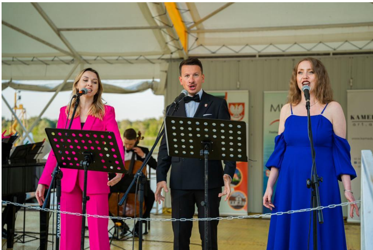
Pierwsza odsłona wydarzenia przyciągnęła tłumy ludzi.